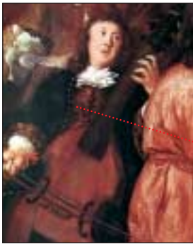
Dietrich Buxtehude als Gambist (Kniegeigen-Spieler)