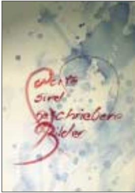
Das Titelmotiv „malschriftmalbild“, des Oldesloer Grafikers Hardy Fürstenau, können Sie, bei einer limitierten Auflage von 100 Stück, im Format 40x60 cm, auf Leinen gedruckt, für 49,-€/Stück bestellen.