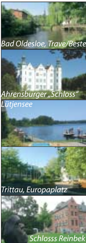
Bad Oldesloe, Trave/Beste

Wer weiter nach Lübeck möchte, kann über die gekennzeichnete Strecke – über Stubbendorf und Groß Wesenberg – wieder zu Trave gelangen. An der Klein Wesenberger Kirche folgt man dem Jacobsweg über Reecke zum Lübecker Ortsteil Moisling bis zum Elbe-Lübeck-Kanal, zur Trave und schließlich zur Lübecker Altstadt mit dem imposanten Holstentor. ghyf