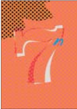
Das Titelmotiv „sieb-n“, des Oldesloer Grafikers Hardy Fürstenau, können Sie, bei einer limitierten Auflage von 100 Stück, im Format 40x60 cm, auf Leinen gedruckt, für 49,- €/Stück bestellen.