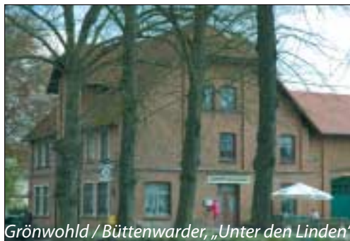
Grönwohld / Büttenwarder, „Unter den Linden“