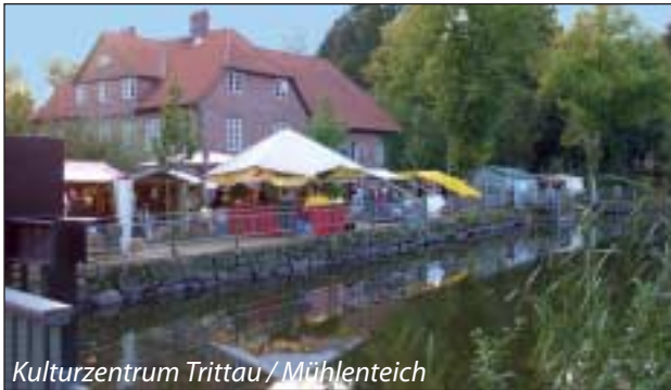
Kulturzentrum Trittau / Mühlenteich