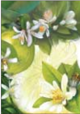
Das Titelmotiv „zitrone_VIP137“, des Oldesloer Grafikers Hardy Fürstenau, können Sie, bei einer limitierten Auflage von 100 Stück, im Format 40x60 cm, auf Leinen gedruckt, für 98,- €/Stück bestellen.