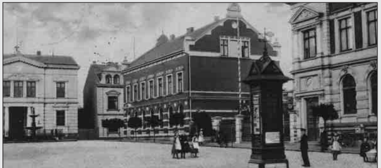
Marktplatz in Bad Oldesloe, 1915 (Ansichtskarte Verlag Kamm No. 1365)