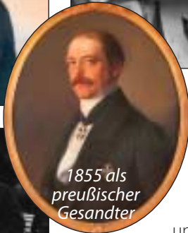
1855 als preußischer Gesandter