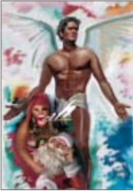
Das Titelmotiv „Mary Xmas“, des Oldesloer Grafikers Hardy Fürstenau, können Sie, bei einer limitierten Auflage von 100 Stück, im Format 40x60 cm, auf Leinen gedruckt, für 49,- €/Stück bestellen.