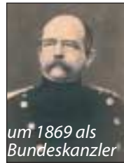
um 1869 als Bundeskanzler