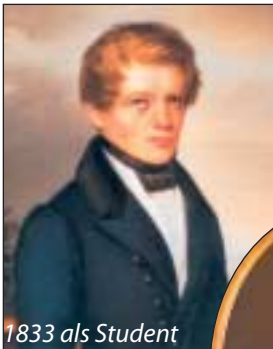
1833 als Student